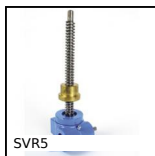
SVR5 Screwjack with travelling nut, with moving nut