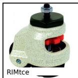
RIMtce Locking castor, with central hole