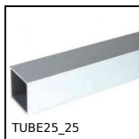
TUBE25_25 Square Tube, Aluminium or Stainless steel