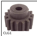
CLG1 Moulded plastic spur gear, Moulded plastic (nylon)