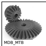
MDB_MTB Moulded plastic bevel gear (nylon), 2:1