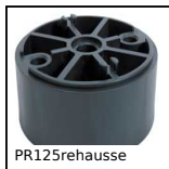
PR125rehausse Extension for articulated foot Ø123, articulated foot PR125