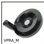
VPRA_M Handwheel with handle, Thermosetting plastic