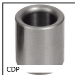
CDP Flanged drill bushing, Steel