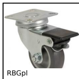
RBGpl Swivel castor with double brake, Steel - grey rubber