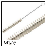
GPLny Brush, nylon