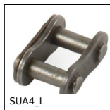
SUA4_L Chain link, Steel