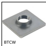
BTCW Cap for square tube to be welded, To be welded