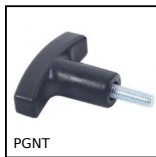
PGNT Thermoplastic T handle, With threaded spindle