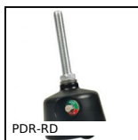
PDR-RD Mounting feet with integrated castors, Offset castor