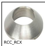
RCC_RCX Spherical tilt washer - DIN6319, convex