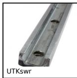
UTKswr Utilitak® V rail, V rail