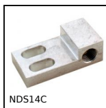
NDS14C Angular connector, Universal angular connector