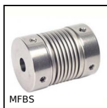
MFBS Stainless steel flexible bellows coupling, Stainless steel - with