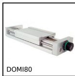
DOMI80 Domino 80 adjustable slide, Slide DOMILINE 80 with counter and handwheels