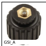
GSI_A Gas control screw for gas spring, Gas