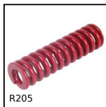
R205 Die spring ISO10243, Heavy