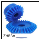
ZHBRA Plastic bevel gear, 1,25:1 2:1 3:1