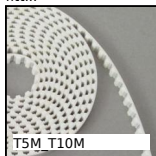
TSM T10M T type timing belt per metre, T10 Steel cored polyurethane