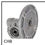
CHB Worm and wheel gear reducer, up to 41 Nm