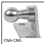
CNA-CNG Right angled mounting plate, Right