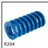
R204 Die spring ISO10243, Average