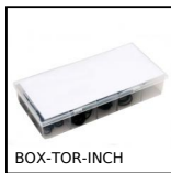
BOX-TOR-INCH Box set of Nitrile O-rings in inch NBR90Sh A, For fasteners and fittings...