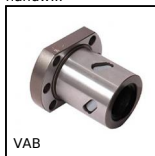
VAB Flanged nut for ball screw, For VAB ballscrew