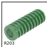
R203 Die spring ISO10243, Light