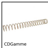
CDGamme Compression spring DIN2095, DIN 2095