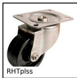
RHTplss High Temperature Castor, up to 200kg