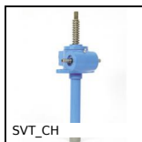
SVT_CH Screwjack - pivot mounting, Pivoting