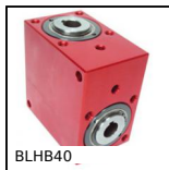
BLHB40 Right angled gearbox, bored shafts, up to 10.3 Nm