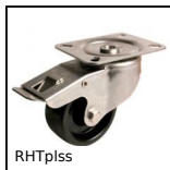
RHTplss High Temperature Castor, up to 200kg