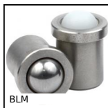
BLM Spring loaded plunger with ball tip, Stainless