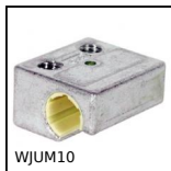
WJUM10 Drylin® W bearing block, Slide