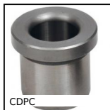
CDPC Flanged drill bushing, Steel