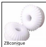
ZBconique Machined plastic bevel gear, 1:1