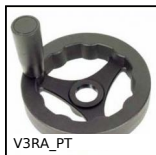
V3RA_PT 3-spoked handwheel with handle, Polyamide