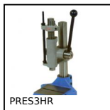
PRES3HR Manual workbench press, Force up to 400kg