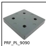
PRF_PL_9090 Joining plate for aluminium profile, Joint plate - 90x90 mm