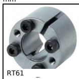
RT61 Self-centering locking Assembly,