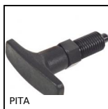
PITA Locking bolt, with T handle