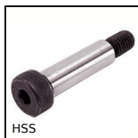
HSS Shoulder screw ISO7379, Hardened Steel class 12.9