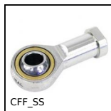
CFF_SS Female rod ends DIN ISO12240-4, Stainless steel / bronze -