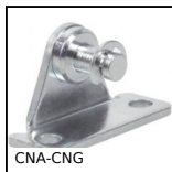
CNA-CNG Right angled mounting plate, Right angled mounting plate for clevis