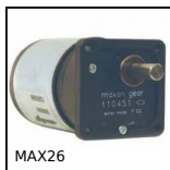
MAX26 Motor-gearbox 12V and 24V DC, from 0,075 to 0,6Nm