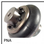
PNA PERIFLEX® elastic coupling, Complete coupling