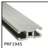
PRF1945 Standard aluminium profile, 19 x 45 mm