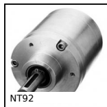
NT92 Spur gear coaxial gearbox, from 15 to 40 Nm - In-line