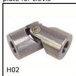
H02 Single needle roller universal joint, Heavy duty