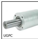
UGPC Actuator guide kit, Short bearing