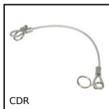
CDR Retaining cable for ball pin, Retaining cable