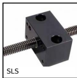
SLS Bearing block for leadscrew, Floating Drylin® bearing block