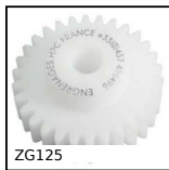
ZG125 Plastic spur gear, Machined plastic (delrin)