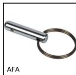
AFA Locking pin, with ring