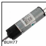
BUH77 Motor-gearbox 12V and 24V DC, from 0.1 to 2 Nm