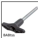
BABTss 303 Stainless steel ball pin, 303 Stainless steel