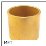
MET Cylindrical sintered bronze bush, Self- lubricating sintered bronze