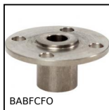
BABFCFO Ball pin socket, Mounting collar with a round flange