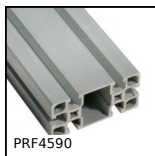
PRF4590 Standard aluminium profile, 45 x 90 mm