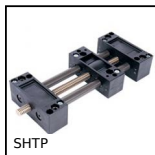
SHTP Drylin® Linear table, Economy range