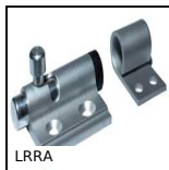
LRRA Latch with locking system, Aluminium