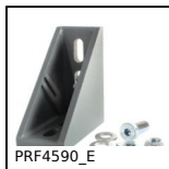
PRF4590_E Bracket for aluminium profile, PRF4590