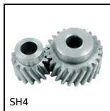
SH4 Parallel axis helical gear, Steel 20NCD2