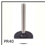
PR40 Articulated foot Ø40, Ø 40