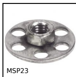
MSP23 Masterplate® glueable insert Ø23, Cylindrical Ø23 with