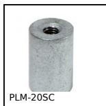
PLM-20SC Threaded cylindrical magnet, With threaded hole