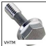
VHTM Hexagonal headed screw Hygienic Design®, Stainless steel