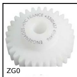
ZG0 Plastic spur gear, Machined plastic (delrin)