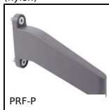
PRF-P Aluminium profile feet support, For feet or casters