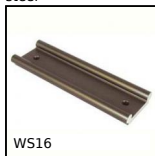
WS16 Drylin® W rail, Rail