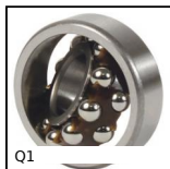
Q1 Self-aligning radial ball bearing, Steel