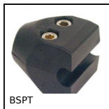
BSPT Single rod clip, Round