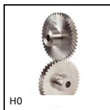
H0 Crossed helical gear crossed axis at 90°, Steel 20NCD2