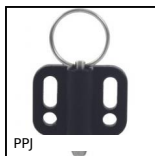
PPJ Indexing plunger with flange, With horizontal mounting flange and pu...