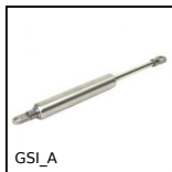
GSI_A Stainless steel adjustable gas spring, Stainless steel