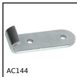
AC144 Crochet plat pour grouillière, 22mm