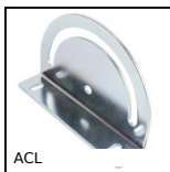
ACL Articulation pour profilé aluminium, Pivot à angle variable