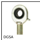
DGSA Embout à rotule mâle, Acier / acier - Série économique