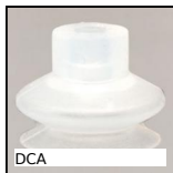
DCA Ventouse 1,5 soufflets, silicone