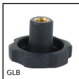
GLB Petit volant à 6 lobes taraudé traversant, Technopolymère -