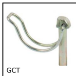
GCT Goupille clip pour tube, clip pour tube