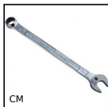
CM Clé mixte Hygienic Usit® et Hygienic Design®, Clé mixte