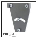
PRF_PA Plaque d'articulation pour profilé aluminium, Plaque