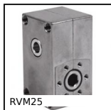
RVM25 Réducteur manuel, Renvoi d'angle