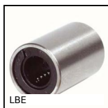
LBE Douille à billes miniature, Miniature