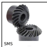
SMS Engrenage spiro- cannique, 1:1