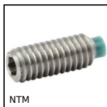
NTM Vis de pression bout en nylon, à bout nylon