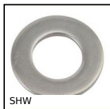
SHW Rondelle simple, Inox A2