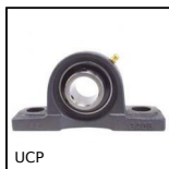
UCP Palier à chapeau fonte, Fonte