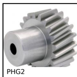
PHG2 Engrenage hélicoïdal axes parallèles de précision, Acier 35NCD6 prétraité