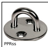
PPRss Pontet sur platine ronde, Inox