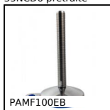
PAMF100EB Pied articulé à embase tôle à fixer Ø100, Pied articulé