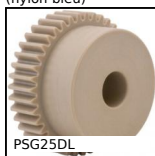
PSG25DL Engrenage droit de précision, Peek