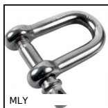
MLY Manille lyre à piton à œil, Acier