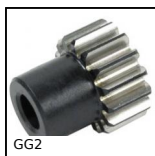
GG2 Engrenage droit denture rectifiée, Acier traité