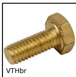
VTHbr Vis à tête hexagonale DIN 933, Laiton