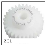
ZG1 Engrenage droit plastique, Plastique usiné (delrin)