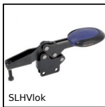
SLHV10k Sauterelle levier horizontal, A levier horizontal / embase verticale