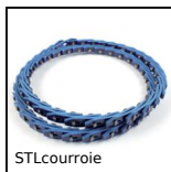
STLcourroie Courroie V à maillons, Pour poulie trapézoïdale SPA, SPB, SPZ