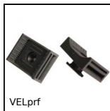
VELprf Embase à clipser pour bande auto-grippante, Polyamide