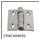
CHAC4040SS Charnière carrée en tôle percée, Carrée rivetée percée