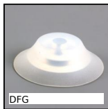
DFG Ventouse, silicone