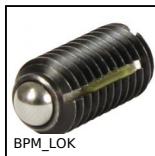
BPM_LOK Poussoir Long-Low avec fente, LONG-LOK - Acier