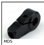
MDS Moyeu de serrage, Acier