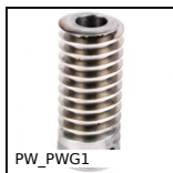
PW_PWG1 Vis sans fin de précision, Acier