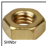
SHNbr Ecrrou 6 pans DIN 934, Laiton