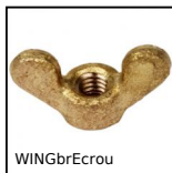
WINGbrEcrrou Ecrrou à oreilles pour serrage manuel DIN315, Laiton DIN 315