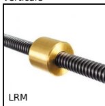
LRM Ecrrou cylindrique bronze, 1 filet bronze