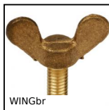
WINGbr Vis à oreilles pour serrage manuel DIN316, Laiton DIN 316