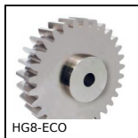
HG8-ECO Engrenage droit acier série éco., Acier C45