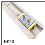
Guidage miniature Drylin® N, Largeur 40 mm