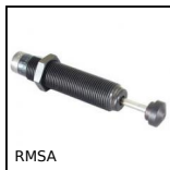
RMSA Amortisseur de chocs réglable, Réglable