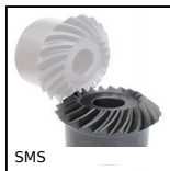
SMS Engrenage spiro-conique, 1:1