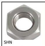
Ecroû 6 pans DIN934, Acier classe 6[8]