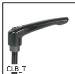
CLB_T Manette indexable Zamak, Zamak