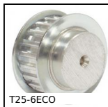
T25-6ECO Poulie dentée de positionnement type T, Série économique - T2,5 a...