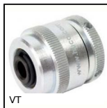
Limiteur de couple à friction Vari-Tork®, 0,53 à 1,32 Nm