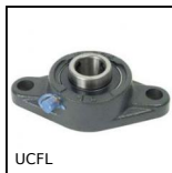
Palier applique fonte, Fonte