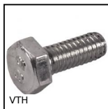
Vis à tête hexagonale, Acier classe 8.8