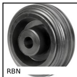
RBN Roue à bandage, Caoutchouc - jante polypropylène