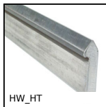
Rail de guidage seul, Rail