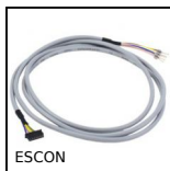
Accessoires pour variateur de vitesse 5A, Kit 4 cables