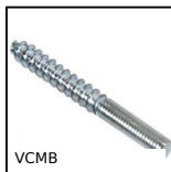
Vis combi bois/métal, Acier