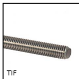
TIF Tige filetée DIN975, Inox A2