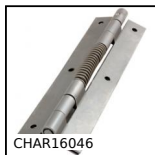
Charnière à ressort, à visser