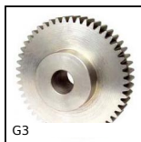
G3 Engrenage droit acier, Acier 20NCD2