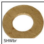
SHWbr Rondelle plate DIN125, Laiton