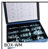
Coffret de rondelles simples DIN125, Coffret de rondelles acier