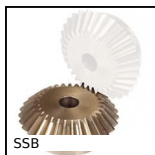
SSB Engrenage conique inox, 1:1