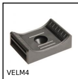
VELM4 Embase à visser pour bande auto-grippante, Polyamide