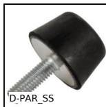
Butée élastique inox , inox