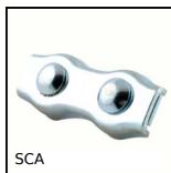
Serre-câble plat, Acier