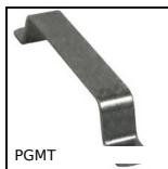
PGMT Poignée de manutention à fixation avant, Acier