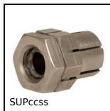
SUPccss Moyeu de serrage autocentrant inox, Avec contre-écrou