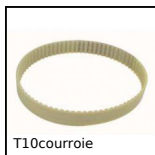
T10courroie Courroie fermée type T, T10 Polyuréthane armature acier