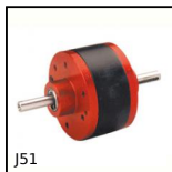
J51 Réducteur coaxial à trains parallèles, de 0,13 à 0,49 Nm - à t...