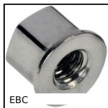
EBC Ecras borgne compact Hygienic Design®, Compact