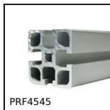
Profilé aluminium standard, 45 x 45 mm