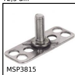
MSP3815 Insert à coller MasterPlate®, rectangulaire,