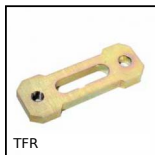
Tendeur fixe rigide, Fixe