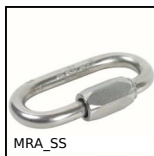
Maillon rapide inox, Inox