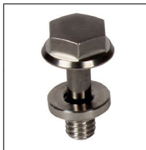
Rondelle avec vis VHTM