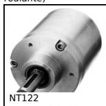
NT122 Réducteur coaxial à trains parallèles, de 32 à 85 Nm - à