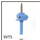
SVT5 Vérin à vis - Avec vis en translation, Vis en translation