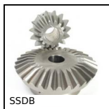
SSDB Engrenage conique inox, 2:1