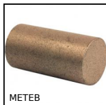
METEB Ebauches autolubrifiantes, Bronze BP25