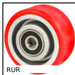
RUR Roue ultra-roulante, Polyuréthane - jante aluminium (ultra-roulante)