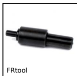
FRtool Outil de montage, Outil de montage