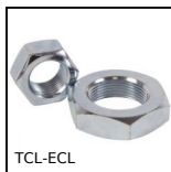
TCL-ECL Ecrrou de réglage, Ecrrou de réglage