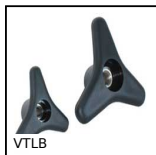
VTLB Volant à main à 3 lobes, Thermoplastique / Insert laiton ou inox