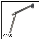
CPAS Compas avec cran de sécurité, Ouverture vers le haut