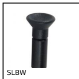
SLBW Bouton d'indexage à souder, Acier à souder