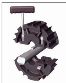
Montage en demi-coques