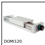
DOMI120 Chariot de réglage Domino 120, Chariot DOMILINE 120 avec compteur e...