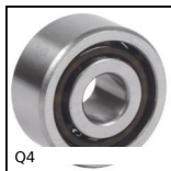
Q4 Roulement à double rangée de billes à contact radial, A contact r...