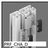
PRF CHA D Charnière et articulation, Charnière dégonflable