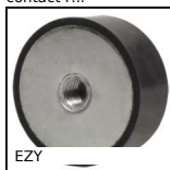
EZY Butée élastique cylindrique, Acier