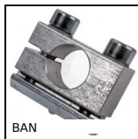
BAN Bride angulaire pour ventouse, Standard