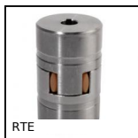
RTE Accouplement élastique Rotex®, fonte