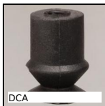
DCA Ventouse 1,5 soufflets, nitrile