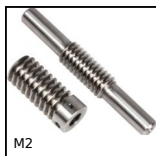
M2 Couple roue et vis sans fin, Acier non trempé