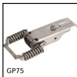
GP75 Grenouillère ressort à bielles, Standard (GP75)