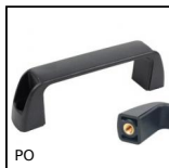
PO Poignée de manutention multi-secteurs, Insert borgne taraudé