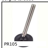
PR105 Pied à rotule Ø103, Ø 103