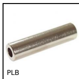
PLB Entretoise cylindrique, Laiton