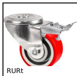
RURt Roulette pivotante à trou central, Polyuréthane - jante aluminium ...