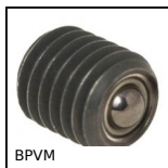
BPVM Bille porteuse vissable miniature, Miniature à visser