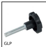
GLP Petit volant à 6 lobes fileté, Technopolymère - Inox