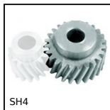
SH4 Engrenage hélicoïdal axes parallèles, Acier 20NCD2