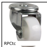
RPCtc Roulette pivotante à trou central, Acier - Polyamide