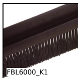
FBL6000_K1 Brosse au mètre, Polyamide 6 noir - petite taille