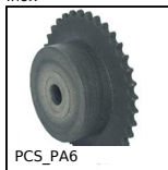
PCS_PA6 Pignon à chaîne plastique, 9,525mm (DIN 06B-1)