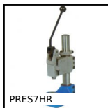
PRES7HR Presse manuelle d'établi, Pression jusqu'à 700kg