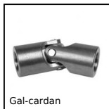
Gal-cardan Cardan simple série éco, Sollicitation légère