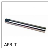
APB_T Axe taraudé pour brides, Taraudé