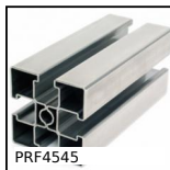
PRF4545 Profilé inox standard, 45 x 45 mm