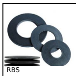
RBS Rondelle dynamique DIN2093, Acier