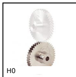
H0 Engrenage hélicoïdal axes croisés, Acier 20NCD2