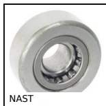
NAST Galet de came, Avec bague intérieure