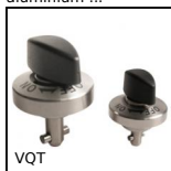
VQT Verrou quart de tour pour bridage, Bouton plastique ou Inox