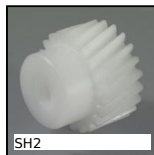
SH2 Engrenage hélicoïdal axes parallèles, Plastique usiné (delrin)