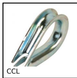
CCL Cosse cœur standard, Acier