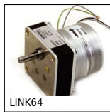
Motoréducteur AC synchrone, de 1,3 à 6Nm