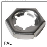
PAL Ecrou de sécurité, Pour blocage axial