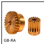
Engrenage droit laiton, Laiton CuZn39Pb3