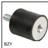
Amortisseur élastique cylindrique, Acier