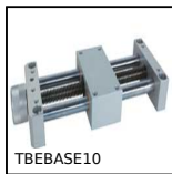
TBEBASE10 Mini-table à vis trapézoïdale économique, économique