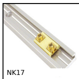
Guidage miniature Drylin® N, Largeur 17 mm