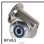
Réducteur à roue et vis sans fin inox, jusqu'à 152Nm