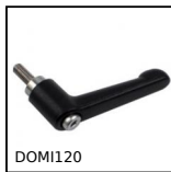
DOMI120 Accessoires de liaison, Levier de serrage