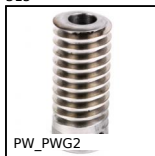
Vis sans fin de précision, Acier