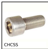
Vis à tête creuse, Inox A2