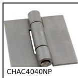
Charnière carrée en tôle non percée, Carrée rivetée non percée