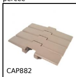
Chaîne à palette à flexion, Large série 882