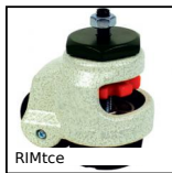
Roulette d'immobilisation, à trou central