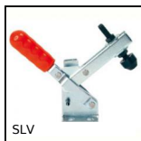
Sauterelle à levier vertical, A levier vertical - acier