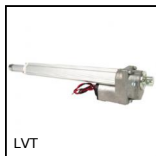
LVT Mini vérin motorisé 4A, 4 ampères