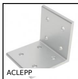
ACLEPP Equerre pour profilé aluminium, 8 trous