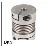
DKN Accouplement miniature soufflet Gerwah®, de 0,4 à