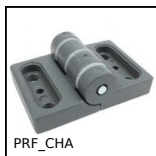
PRF_CHA Charnière pour profilé aluminium, Charnière en façade