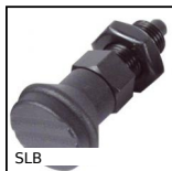
SLB Bouton d'indexage, acier classe 5.8