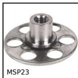
MSP23 Insert à coller MasterPlate® cylindrique Ø23, cylindrique Ø23 av...