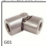
G01 Cardan simple, Sollicitation normale