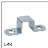
LRR Gâche pour loquet à ressort, Gâche