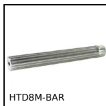
HTD8M-BAR Barreau denté type HTD, HTD8