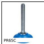
PR65C Pied semi-rotulé oscillant Ø 65, Ø 65