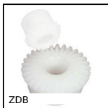
ZDB Engrenage conique plastique usiné (delrin), 2:1