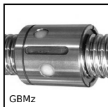
GBMz Ecroû cylindrique pour vis à billes, Ecroû cylindrique à filets mu...