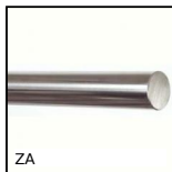
ZA Arbre pour guidage linéaire, Acier trempé