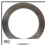
IN2 Engrenage interne, Acier 20NCD2