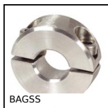
BAGSS Bague de blocage inox, Inox