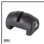
BRI Accessoires pour panneau, Bride pour panneaux