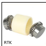
RTK Accouplement à denture bombée Bowex®, Nylon et