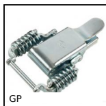
GP Grenouillère ressort à biellettes, Standard