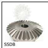
SSDB Engrenage conique inox, 2:1