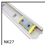
NK27 Guidage miniature Drylin® N, Largeur 27 mm