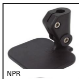
NPR Noix porte réflecteur,