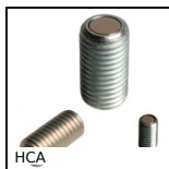
HCA Vis aimantée tête hexagonale creuse, Acier