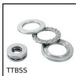
TTBSS Butée à billes simple effet inox, Inox