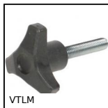
VTLM Petit volant mâle à 3 lobes, Polyamide - Acier