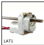
LAT1 Actionneur linéaire motorisé 1A, 1 ampère