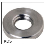
RDS Rondelle de sécurité Hygienic Usit®, Inox