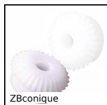
ZBconique Engrenage conique plastique usiné (delrin), 1:1