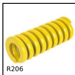
R206 Ressort extra raide ISO10243, Extra-forte