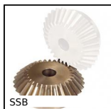
SSB Engrenage conique inox, 1:1