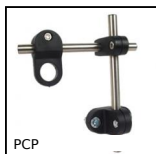
PCP Structure porte-cellule plastique, Pré- assemblée