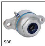
SBF Palier applique étanche agro- alimentaire, ouvert