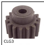
CLG3 Engrenage droit plastique moulé, Plastique moulé (nylon)