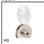
H0 Engrenage hélicoïdal axes croisés, Acier 20NCD2