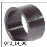
OP3_14_06 Douille de réduction pour indicateur OP, Douille de réduction