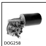
DOG25H Motorréducteur 12V et 24V DC, de 12 à 15 Nm