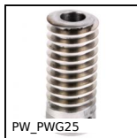
PW_PWG25 Vis sans fin de précision, Inox