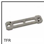
TFR Tendeur fixe rigide, Fixe