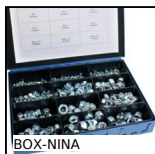
BOX-NINA Ecrus autofreinés - DIN985, Coffret d'écrous acier