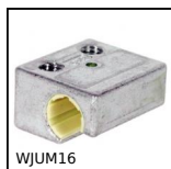
WJUM16 Patin Drylin® W, Patin