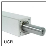
UGPL Guidage de vérin en kit, Palier long