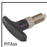
PITAss Doigt d'indexage, avec poignée en T