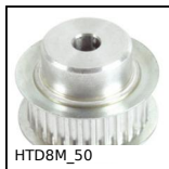
HTD8M_50 Poulie dentée de transmission type HTD, HTD8 Fonte