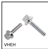
VHEH Vis H avec embase Hygienic Usit®, Inox