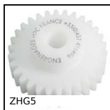
Engrenage droit plastique, usiné (delrin)