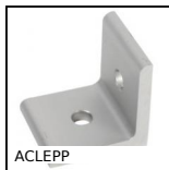
Equerre pour profilé aluminium, 2 trous