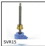
SVR15 Vérin à vis - Avec écrou de déplacement, Avec écrou de déplace...