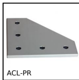
Plaque de liaison pour profilé aluminium, Connexion à angle droit