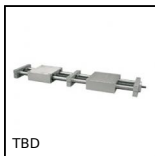
TBD Table à pas inversé manuelle, 40kg