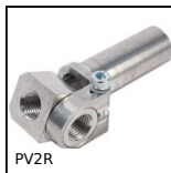
Porte-ventouse orientable, Serrage renforcé