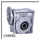
Réducteur à roue et vis sans fin, jusqu'à 540 Nm