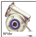
Bras de réaction inox, Bras de réaction