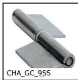
Paumelle à ailettes de soudure, A souder