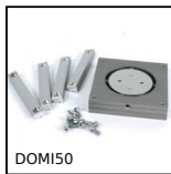
DOMI50 Accessoires de liaison, Plateau tournant