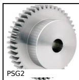
PSG2 Engrenage droit de précision, Acier 20NCD2 cémenté trempé