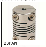
B3PAN Panamech Multi-Beam inox, Inox - avec mâchoires de serrage