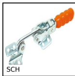
Sauterelle à crochet horizontal, A crochet horizontal - acier