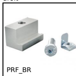
Bride pour profilé aluminium, Bride pour profilé