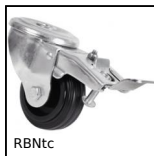
Roulette pivotante à trou central, Acier - Caoutchouc - à double b...