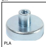
Aimant plat, Aimant plat avec trou taraudé