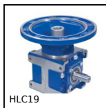
Renvoi d'angle à denture spiro-conique, jusqu'à 43Nm