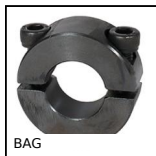
BAG Bague de blocage acier, Acier