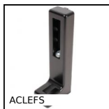
ACLEFS Ancrage pour profilé aluminium, Ajustable