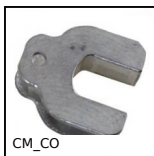
CM_CO Insert de protection Hygienic Usit® et Hygienic Design®, Insert de...