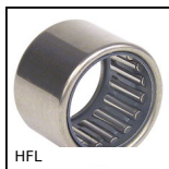
HFL Roue libre acier combinée à aiguilles, Combinée à aiguilles