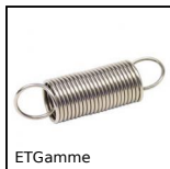
ETGamme Ressort de traction DIN2097, DIN 2097