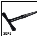
SERB Clef universelle pour batteuse, Clef universelle pour serrure batteuse