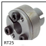
RT25 Frette de serrage épaulé autocentrante, Couple moyen/élevé