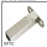
EFTC Élément de soutien, Inox