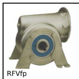
RFVfp Pied support inox, Pied support