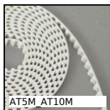
AT5M AT10M Courroie ouverte au mètre type AT, AT5 Polyuréthane