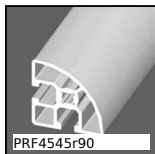
PRF4545r90 Profilé aluminium standard, 45 x 45 mm - R90°