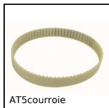
AT5courroie Courroie de positionnement type AT, AT5 Polyuréthane armature acier