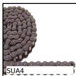
SUA4 Chaîne simple au mètre, Acier