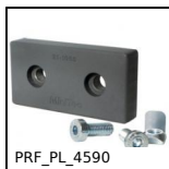
PRF_PL_4590 Plaque de liaison pour profilé aluminium, Plaque de liaison - 45x90...