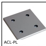
ACL-PL Plaque de liaison pour profilé aluminium, Plaque de liaison - 86x86...