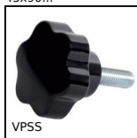
VPSS Petit volant à 6 lobes fileté, Duroplast - Inox