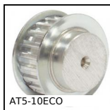
AT5-10ECO Poulie dentée de positionnement type AT, Série économique - AT5 a...