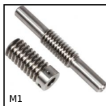
M1 Couple roue et vis sans fin, Acier non trempé