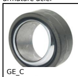
GE_C Rotule lisse, Chrome dur / PTFE