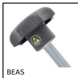
BEAS Bouton étoile antistatique, Etoile, antistatique