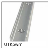
UTKpwrr Rail en V Utilitrack®, Rail en V