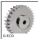
G-ECO Engrenage droit acier série éco., Acier C45