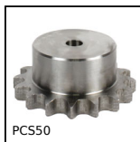
Pignon à chaîne acier, 12,7mm (DIN08B-1)