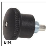
BIM Bouton d'indexage miniature, miniature