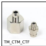
Insert pour ventouse, Insert pour ventouse encliquetable