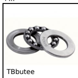
TBbutée Butée à billes simple effet acier, Billes acier