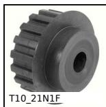
Poulie dentée de positionnement type T, Série économique - T10 pl...