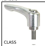
CLASS Manette indexable inox, Inox