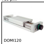
Chariot de réglage Domino 120, Chariot DOMILINE 120