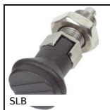
Bouton d'indexage, inox