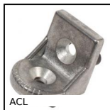
ACL Articulation pour profilé aluminium, Equerre à angle variable