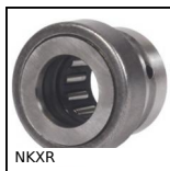
NKXR Roulement combiné sans bague interne, A aiguilles et à butée à r...