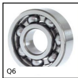
Roulement à billes à contact radial, Acier