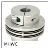
MHWC Accouplement flexible à disque doubles, Disque double