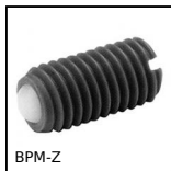
BPM-Z Poussoir plastique à bille à ressort avec fente, Corps plastique +...