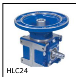
Renvoi d'angle à denture spiro-conique, jusqu'à