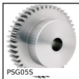
Engrenage droit de précision, Inox 316