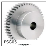
Engrenage droit de précision, Acier 35NCD6 prétraité