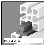
Guidage pour profilé aluminium, Rail Parallèle