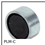
PLM-C Aimant plat de maintien, Aimant plat de maintien