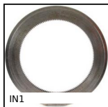
IN1 Engrenage interne, Acier 20NCD2