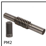
PM2 Couple roue et vis sans fin, Acier trempé