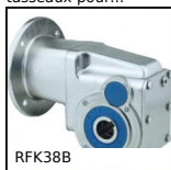
RFK38B Réducteur hypoïde inox, jusqu'à 200Nm