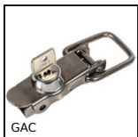
GAC Grenouillère rigide à serrure, Verrouillable