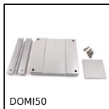
DOMI50 Accessoires de liaison, Platine