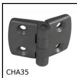
CHA35 Charnière en façade pour profilé aluminium, Charnière