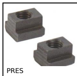
PRES Accessoires pour presse PRES-3HR et PRES-4HR, Jeu de 2 tasseaux pour...