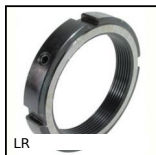
LR Ecrou de réglage et de serrage, Ecrou de réglage