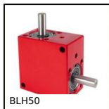
BLH50 Renvoi d'angle, de 7,70 à 20 Nm