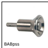
BABpss Broche à billes inox 301, Inox