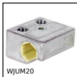
WJUM20 Patin Drylin® W, Patin