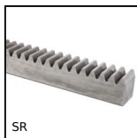
SR Crémaillère section étroite, Inox