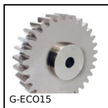
G-ECO15 Engrenage droit acier série éco., Acier C45