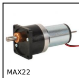
MAX22 Motoréducteur 12V et 24V DC, de 0,07 à 0,2Nm