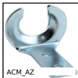
ACM_AZ Crochet pour attache- capot manuelle, Crochet