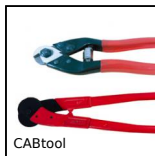
CABtool Outils pour câble d'accastillage, Outils de coupe