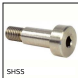
SHSS Vis épaulée inox 416, Inox 416 pré-traité