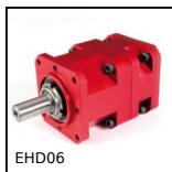
EHD06 Réducteur coaxial, de 8 à 19 Nm