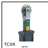
TCXR Tendeur de chaînes automatique, Avec pignon inox