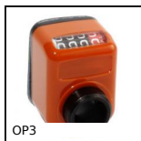
OP3 Indicateur numérique de position mécanique, 4 chiffres