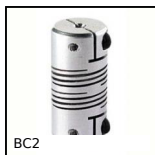
BC2 Panamech Multi- Beam, Aluminium - avec mâchoires de serrage