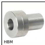
HBM Douille de réglage seule, Douille de réglage