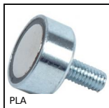
PLA Aimant plat, Aimant plat avec filetage