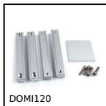
DOMI120 Kit de raccordement, Kit de raccordement XY