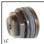
LC Limiteur de couple à friction, 30 à 240 Nm