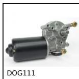
DOG11 Motoréducteur 12V et 24V DC, de 1,5 à 6 Nm