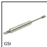
GSI Vérin à gaz inox, Inox