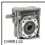
CHMR110 Réducteur à roue et vis sans fin, jusqu'à 980 Nm