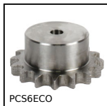
PCS6ECO Pignon à chaîne acier, 6mm (DIN 04-1)