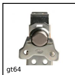
gt64 Grenouillère tournante, Application courante