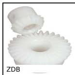
ZDB Engrenage conique plastique usiné (delrin), 2:1