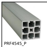
PRF4545_P Profilé aluminium pelable, 45 x 45 mm