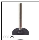
PR125 Pied à rotule Ø123, Ø 123