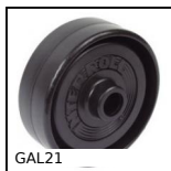
GAL21 Galet de manutention, Plastique