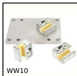
WW10 Chariot Drylin® W, Chariot