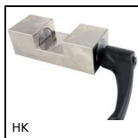
HK Accessoire de serrage manuel, Serrage manuel LRX