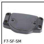
Support façade , Support - montage en façade