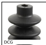
Ventouse 2,5 soufflets, nitrile