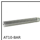
Barreau denté de positionnement AT, AT10