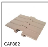
Chaîne à palette à flexion, Large série 882