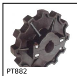
Pignon de traction, Série 882