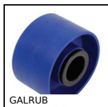
Galet pour convoyeur, Caoutchouc