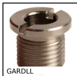
Douille de logement pour goupille d'arrêt, Acier nickelé ou Inox