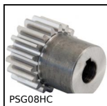
Engrenage droit traité retailé de précision, Acier 20NCD2