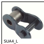
Maillon coudé pour chaîne simple, Acier