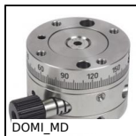
Table rotative de réglage Domino, 55/1