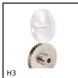
Engrenage hélicoïdal axes croisés, Acier 20NCD2