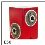
Réducteur à renvoi d'angle, de 3 à 41 Nm