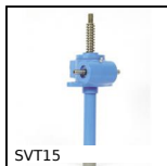
Vérin à vis - Avec vis en translation, Vis en translation