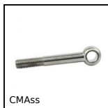
CMAss Chape à œil, Inox