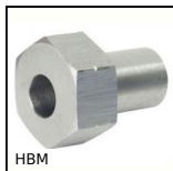
HBM Douille de réglage seule, Douille de réglage