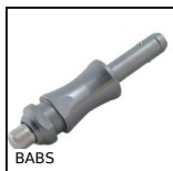
BABS Broche à billes compacte inox 630, Inox trempé