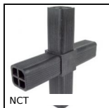
NCT Noix de connexion, A angle fixe