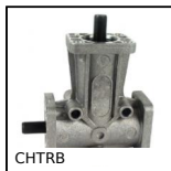
CHTRB Réducteur à renvoi d'angle en L ou T, Jusqu'à 53,1 Nm