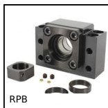
RPB Bloc palier pour vis à billes, Bloc palier