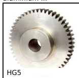
HG5 Engrenage droit acier, Acier 20NCD2