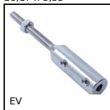
EV Embout à visser inox pour câble, Embout fileté