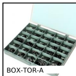
BOX-TOR-A Coffret de joints toriques en nitrile, 2,90 x 1,78mm à 28,17 x 3,53