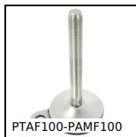
PTAF100-PAMF100 Pied articulé à embase tôle à fixer Ø100, Ø 100