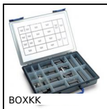
BOXKK Coffret de clavettes, Coffret acier ou inox