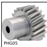
PHG05 Engrenage hélicoïdal axes parallèles de précision, Acier 20NCD2 ...