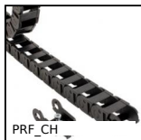
PRF_CH Chaîne porte câble pour profilé aluminium, Chaîne au mètre encl...