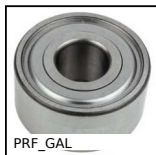
PRF_GAL Galet pour profilé aluminium, Galet plat