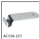
AC156-157 Crochet pour grenouillère rigide, 25,5mm