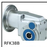
RFK38B Réducteur hypoïde inox, jusqu'à 200Nm