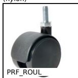
PRF_ROUL Roulette pour profilé aluminium, Sans frein