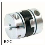
BGC Accouplement Oldham, avec mâchoires de serrage