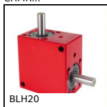
BLH20 Doigt d'indexage à levier, à levier