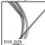
D19 D29 Ressort de compression au mètre acier, au mètre