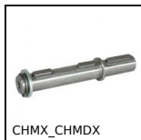
CHMX_CHMDX Arbre pour réducteur CHMR et CHM, Arbre simple pour réducteur CHMR...