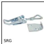
SRG Grenouillère rigide réglable, Course de 96mm à 121,7mm