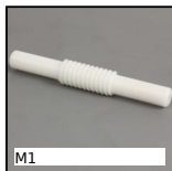
M1 Couple roue et vis sans fin, Plastique usiné (delrin)