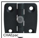
CHAEpac Charnière en façade carrée, chargée fibres de carbone