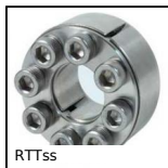
RTTss Frette de serrage non auto-centrante, Couple moyen/élevé