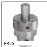
PRES Accessoires pour presse PRES-3HR et PRES-4HR, Réglage micrométrique...