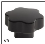
VB Petit volant à 6 lobes taraudé, Duroplast - Laiton