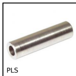
PLS Entretoise cylindrique, Inox 303