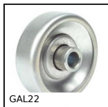
GAL22 Galet de manutention, Acier zingué