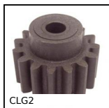
CLG2 Engrenage droit plastique moulé, Plastique moulé (nylon)