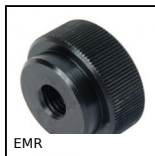
EMR Ecrou moleté à serrage rapide, Moleté