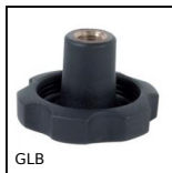
GLB Petit volant à 6 lobes taraudé traversant, Technopolymère - Inox