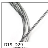
D19_D29 Ressort de compression au mètre inox, au mètre