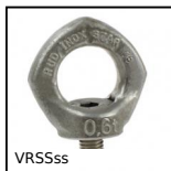
VRSSs Anneau de levage orientable mâle inox, Orientable mâle inox