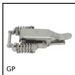
GP Grenouillère ressort à biellettes, Standard (GP22-GP23)