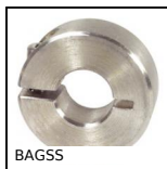
BAGSS Bague de blocage inox, Inox