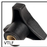
VTLF Petit volant femelle à 3 lobes, Polyamide - Laiton