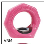
VRM Anneau de levage orientable femelle, Orientable femelle