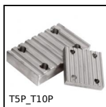
T5P_T10P Plaque de jonction type T, T10