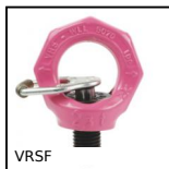
VRSF Anneau de levage orientable mâle, Orientable mâle