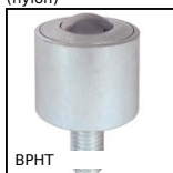
BPHT Bille porteuse à visser, Forte