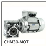
CHM30-MOT Motoréducteur AC asynchrone triphasé, 0,09 à 0,22