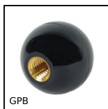
GPB Poignée sphérique femelle taraudée, Avec insert laiton