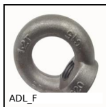
ADL_F Anneau de levage femelle DIN582, Acier