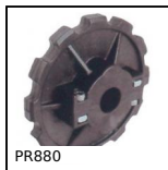
PR880 Roue de renvoi, Série 880