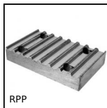
RPP Plaque de jonction type RPP, RPP5