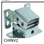
CHINV2 Charnière invisible, Invisible - Ouverture jusqu'à 125°