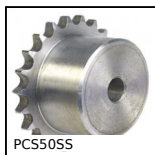
PCS50SS Pignon à chaîne inox, 12,7mm (DIN 08B-1)