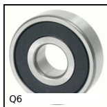
Q6 Roulement à billes, Acier