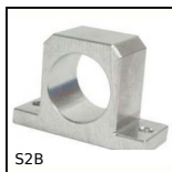
S2B Palier court pour douille à billes fermée, Fermé court