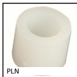
PLN Entretoise cylindrique, Thermoplastique