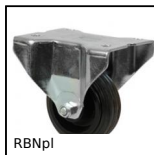
RBNpl Roulette fixe à platine, Acier - Caoutchouc