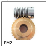
PM2 Couple roue et vis sans fin, Bronze