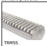
TRMSS Crémaillère section circulaire, Inox - module 1-5