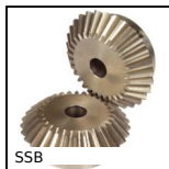
SSB Engrenage conique, 1:1