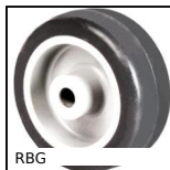
RBG Roue à bandage, Caoutchouc gris - jante polypropylène