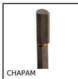
CHAPAM Paumelle à souder à bout plat, Acier