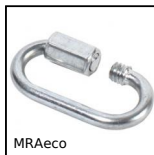
MRAeco Maillon à visser économique, Acier