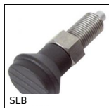
SLB Bouton d'indexage, inox