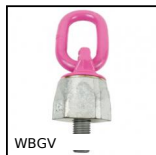
WBGV Anneau de levage, A maillon à visser