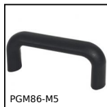
PGM86-M5 Poignée de manutention, Thermoplastique