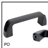
PO Poignée de manutention multi- secteurs, Trou lisse