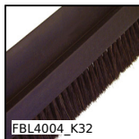
FBL4004_K32 Brosse au mètre, Polypropylène noir strié (PP)