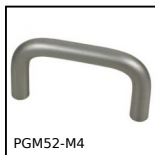
PGM52-M4 Poignée de manutention, Aluminium