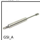
GSI_A Vérin à gaz ajustable inox, Inox