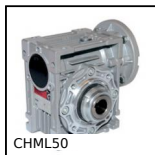
CHML50 Réducteur à roue et vis sans fin, jusqu'à 107 Nm - Avec limiteur ...