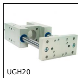
UGH20 Unité de guidage en H, Pour vérins Ø20