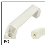
PO Poignée de manutention multi- secteurs, Insert borgne taraudé