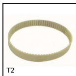
T2 Courroie fermée type T, T2,5 Polyuréthane armature acier