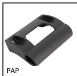
PAP Poignée pour profilé aluminium, Poignée ergonomique