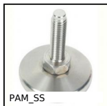
PAM_SS Pied massif à rotule inox, Ø 30 & 40