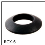
RCX-6 Rondelle à portée sphérique DIN6319, convexe