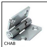
CHAB Charnière à butée intégrée, Charnière