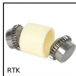
RTK Accouplement à denture bombée Bowex®, Nylon et acier