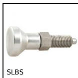
SLBS Bouton d'indexage tout inox, Tout inox