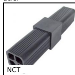
NCT Noix de connexion, A angle fixe