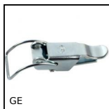
GE Grenouillère élastique à anneau, Standard