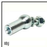
IBJ Embout à rotule à 180° acier, Acier