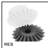
MEB Engrenage conique plastique moulé (nylon), 1:1