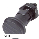
SLB Bouton d'indexage, acier classe 5.8