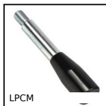
LPCM Levier avec poignée cylindrique, Duroplast noir, levier en acier