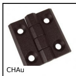
CHAu Charnière en façade, Ouverture 270 degrés