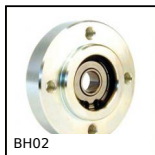
BH02 Bride avec roulement, Montage avec circlips