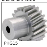
PHG15 Engrenage hélicoïdal axes parallèles de précision, Acier 35NCD6 prétraité