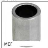
MEF Coussinet cylindrique, Alliage de Fer FP20 auto-lubrifiant METAFRAM