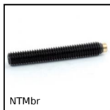
NTMbr Vis de pression bout en laiton, à bout laiton