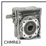
CHMR63 Réducteur à roue et vis sans fin, jusqu'à 196 Nm