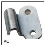
AC Crochet pour grenouillère, 15mm