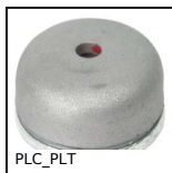
PLC_PLT Aimant avec trou central, Avec trou central