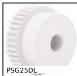
PSG25DL Engrenage droit de précision, Delrin