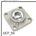
UCF_SS Palier applique tout inox, Inox