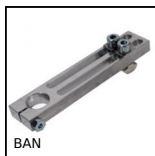
BAN Bride angulaire pour ventouse, Ajustable