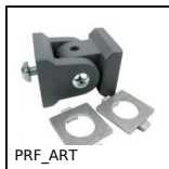
PRF_ART Articulation de profilé, Simple