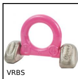
VRBS Anneau de levage articulé à souder, Articulé à souder