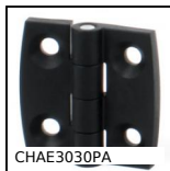
CHAE3030PA Charnière en façade carrée, Polyamide