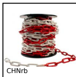
CHNrb Chaîne de signalisation rouge et blanche, Acier