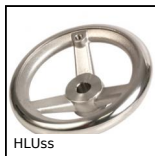
HLUss Volant à bras, Inox 316