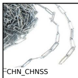
CHN_CHNSS Chaîne droite à maillons longs, Acier zingué