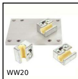
WW20 Chariot Drylin® W, Chariot