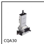
CQA30 Accessoire pour chariot de réglage, 30