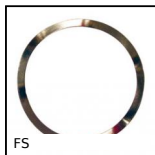
FS Rondelle élastique ondulée, Rondelle élastique