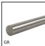
GR Arbre de précision rectifié, Inox