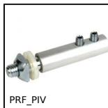
PRF_PIV Pivot de porte pour profilé aluminium, Pivot de porte