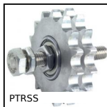
PTRSS Pignon tendeur pour chaîne, Pour milieux agressifs