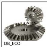
DB_ECO Engrenage conique série éco., 2:1