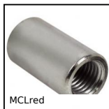
MCLred Manchon réducteur femelle/femelle, Cylindrique - inox