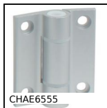
CHAE6555 Charnière en façade esthétique, Aluminium