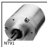
NT91 Réducteur coaxial à trains parallèles, de 10 à 35 Nm - à trains