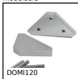
DOMI120 Kit de raccordement, Kit de raccordement XZ