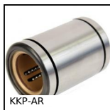
KKP-AR Douille à billes à chemins de billes inclinés, Forte charge