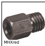
MHXred Manchon réducteur mâle/femelle, Hexagonal - acier