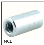
MCL Manchon cylindrique taraudé, Cylindrique - acier