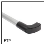
ETP Poignée modulable pour profilé aluminium, Poignée modulable