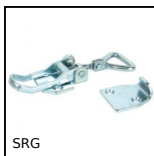
SRG Grenouillère rigide réglable, Course de 117,4mm à 128mm