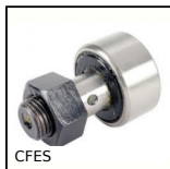
CFES Galet de came à excentrique, Excentrique