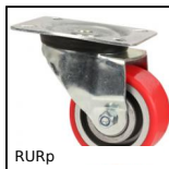
RURp Roulette ultra-roulante à platine, Polyuréthane - jante aluminium ...