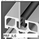
PRF_JL6 Joint à lèvres pour panneau pour profilé aluminium, Joint à lèvres...