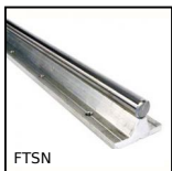
FTSN Arbre supporté pour guidage linéaire, Arbre acier / support alumin...