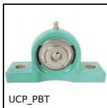
UCP_PBT Palier à chapeau polymère inox, Polymère et inox