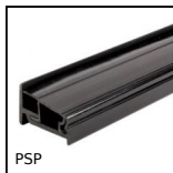
PSP Profil support de panneau, Profil support de panneaux