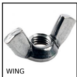
WING Ecroû à oreilles pour serrage manuel, Inox DIN 314/315