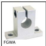
FGWA Support d'extrémité d'arbre, A semelle