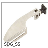
SDG_SS Support de guide universel, Inox