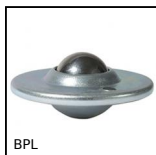
BPL Bille porteuse avec flasque, Légère