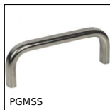
PGMSS Poignée de manutention inox, Inox