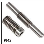
PM2 Couple roue et vis sans fin, Acier non trempé