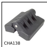
CHA138 Charnière à visser avec insert taraudé, 138 degrés