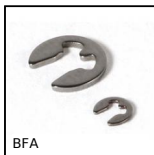
BFA Bague de frein pour arbres, Anneau type E