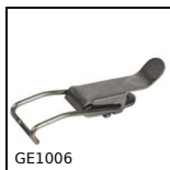
GE1006 Grenouillère élastique à anneau, Pour accrochage en gorge