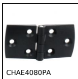
CHAE4080PA Charnière en façade rectangulaire, Polyamide