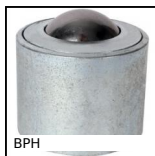
BPH Bille porteuse à encastrer, Forte