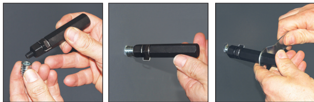
Exemple de mise en œuvre