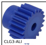
CLG3-ALI Engrenage droit contact alimentaire, Plastique moulé (nylon bleu)