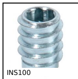
INS100 Insert auto-taraudeur filet large, Filet large