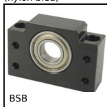
BSB Bloc palier pour vis à billes, Bloc palier