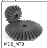
MDB_MTB Engrenage conique plastique, 2:1