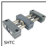
SHTC Table linéaire DryLin®, Sans entretien