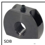
SDB Doigt d'indexage - Support, fixation perpendiculaire au