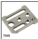
TMR Tendeur fixe rigide, Manuel