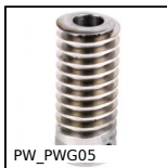
PW_PWG05 Vis sans fin de précision, Inox