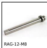
RAG-12-M8 Accessoire pour rampe à galets, Système d'ancrage