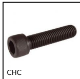
CHC Vis à tête creuse DIN 912, Acier classe 12.9