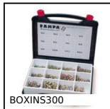
BOXINS300 Coffret inserts auto- taraudeurs, Coffret - pour matériaux durs