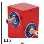
E15 Réducteur à renvoi d'angle, de 0,40 à 2,53 Nm