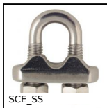
SCE_SS Serre-câble à étrier inox, Inox