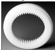
ZIN : Plastique