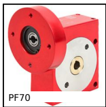
PF70 Réducteur à roue et vis sans fin, jusqu'à 164 Nm