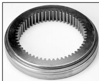
IN : Acier