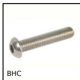
BHC Vis à tête bombée, Inox A2