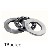
TButee Butée à billes simple effet acier, Billes acier