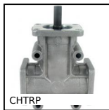
CHTRP Réducteur à renvoi d'angle en L ou T, Jusqu'à 75,7 Nm