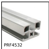
PRF4532 Profilé aluminium standard, 45 x 32 mm