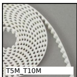
TSM_T10M Courroie ouverte au mètre type T, T5 Polyuréthane