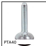
PTA40 Pied articulé à embase tôle Ø 40, jusqu'à 3000N