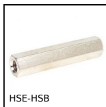
HSE-HSB Entretoise hexagonale, Laiton