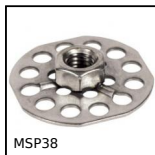
MSP38 Insert à coller MasterPlate® cylindrique Ø38, cylindrique Ø38 av...