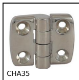
CHA35 Charnière en façade pour profilé aluminium, Charnière