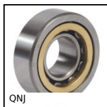
QNJ Roulement à rouleaux cylindriques acier, Bague intérieure