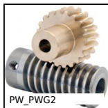
PW_PWG2 Roue de précision, Bronze