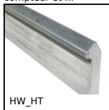
HW_HT Rail de guidage seul, Rail