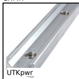
UTKpwr Rail en V Utilitrack®, Rail en V