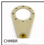
CHMBR Bras de réaction, Bras de réaction pour réducteurs CHM et CHMR