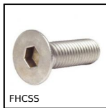
FHCSS Vis à tête fraisée , Inox A2 DIN 7991