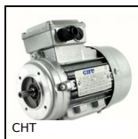
CHT Moteur AC asynchrone triphasé, 0,18 à 0,55kW