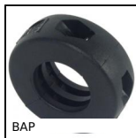
BAP Bague d'arrêt plastique, Ø10 à Ø20