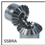
SSBRA Engrenage conique inox, 1:1