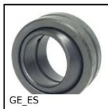
GE_ES Rotule lisse, Acier / acier