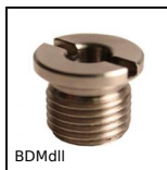
BDMdl Douille magnétique pour broche, Blocage magnétique rapide et léger