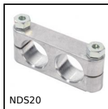
NDS20 Noix de serrage pour ventouse, Parallèle