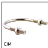
EIM Etrier inox, Inox