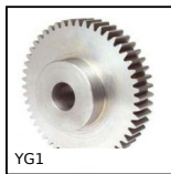
YG1 Engrenage droit PERFORMANCE, Acier 35NCD6