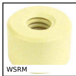
WSRM Ecrou cylindrique polymère, 1 filet polymère (Iglidur®)