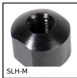
SLH-M Ecrou pour sauterelle à levier verrouillable, Ecrou pour SLH/SLV