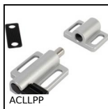
ACLLPP Loquet pour profilé aluminium, Loquet à ressort