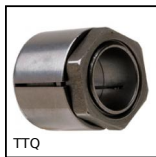
TTQ Frette de serrage 6 pans, Couple moyen