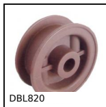
DBL820 Diabolo pour chaîne à palettes, Série 820 et 815