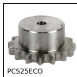
PCS25ECO Pignon à chaîne acier, 6,35mm