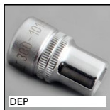
DEP Douille Hygienic Usit® et Hygienic Design®, Douille pour le montage...