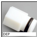
DEP Insert de protection Hygienic Usit® et Hygienic Design®, Insert de...