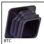
BTC Bouchon pour tube carré, Simple