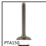
PTA150 Pied articulé à embase tôle Ø150, jusqu'à 40000N