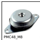
PMC48_M8 Pied de machine antivibratoire, Plaque de base ovale