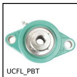
UCFL_PBT Palier applique polymère inox, Polymère et inox