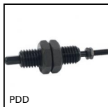
PDD Poussoir de détection, Avec axe de détection anti-rotation