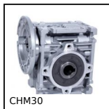
CHM30 Réducteur à roue et vis sans fin, jusqu'à 28 Nm