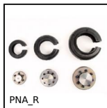
PNA_R Bandage de rechange PERIFLEX®, Bandage de rechange