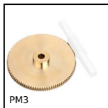
PM3 Couple roue et vis sans fin, Bronze