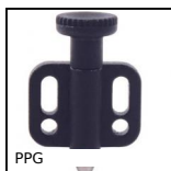
PPG Bouton d'indexage à bride, à bride de fixation horizontale