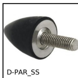
Butée élastique inox, inox