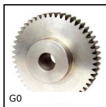
Engrenage droit acier, Acier 20NCD2