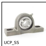
UCP_SS Palier à chapeau tout inox, Inox