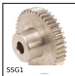
Engrenage droit inox, Inox 304L