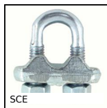
Serre-câble à étrier, Acier