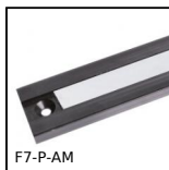
F7-P-AM Bande magnétique, Bande magnétique