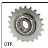
Disque tendeur pour chaîne, Disque tendeur acier