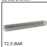
T2,5-BAR Barreau denté type T, T2,5