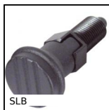
Bouton d'indexage, acier classe 5.8