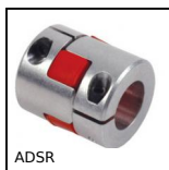
ADSR Accouplement sans jeu Gerwah®, de 12,5 à 525Nm