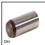
Goupille pleine, standard DIN 6325