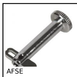
AFSE Axe de fixation avec sûreté à enclenchement, avec sûreté à enc...