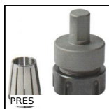
PRES Accessoires pour presse PRES-3HR et PRES-4HR, Porte-