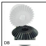
DB Engrenage conique acier, 2:1