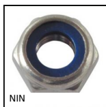
Ecrou autofreiné, Acier