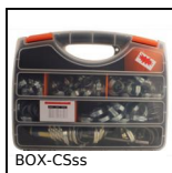
BOX-CSss Coffret de collier de serrage, Coffret colliers inox