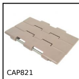
Chaîne à palette droite, Large série 821