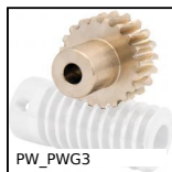
Roue de précision, Bronze