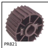
Roue de renvoi, Séries 821 et 805