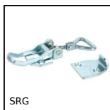
Grenouillère rigide réglable, Course de 117,4mm à 128mm