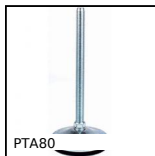
PTA80 Pied articulé à embase tôle Ø80, jusqu'à 10000N