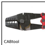
CABtool Outils pour câble d'accastillage, Outils de sertissage