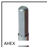
AHEX Arbre hexagonal , Arbre hexagonal