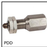
PDD Poussoir de détection à pas fin, Avec adaptation pour capteur