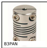
B3PAN Panamech Multi-Beam inox, Inox - avec mâchoires de serrage