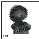
DB Engrenage conique acier, 2:1