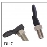
DILC Doigt d'indexage à levier, à levier