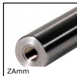
ZAmm Arbre taraudé pour guidage linéaire, Acier trempé rectifié