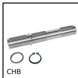
CHB Arbre de sortie simple, Pour réducteur CHB