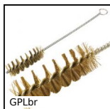
GPLbr Goupillon, laiton