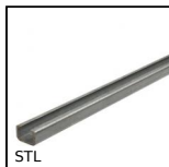
STL Brosse de guidage - Rail, Rail