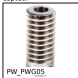
PW_PWG05 Vis sans fin de précision, Inox