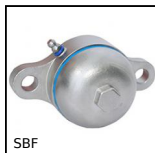
SBF Palier applique étanche agro- alimentaire, fermé