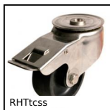
RHTtcss Roulette Hautes températures, jusqu'à 200kg