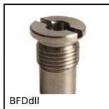
BFDdII Douille de réception pour broche de fixation, Acier nickelé