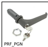
PRF_PGN Poignée de porte pour profilé alu aluminium, Poignée avec serrure