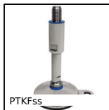
PTKFss Pied articulé oscillant fixable agroalimentaire, Inox - norme 3A