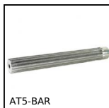
AT5-BAR Barreau denté de positionnement AT, AT5