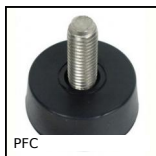
PFC Pied fixe, Mise à niveau de petits éléments