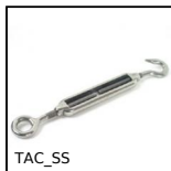
TAC_SS Tendeur à anneau et crochet, Inox