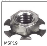
MSP19 Insert à coller MasterPlate® cylindrique Ø19/Ø20, cylindrique av...