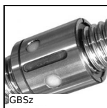
GBSz Ecrou cylindrique pour vis à billes, Ecrou cylindrique