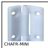
CHAFR-MINI Charnière à friction miniature, A friction