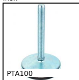
PTA100 Pied articulé à embase tôle Ø100, jusqu'à 15000N