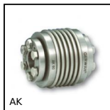
AK Accouplement soufflet Gerwah®, de 36 à 800Nm