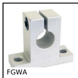
FGWA Support d'extrémité d'arbre, A semelle