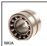
NKIA Roulement combiné avec bague interne, Charge axiale dans 1 sens