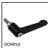
DOMI50 Accessoires de liaison, Levier de serrage