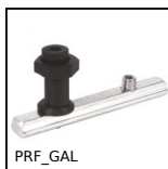
PRF_GAL Galet pour profilé aluminium, Kit de fixation pour galet