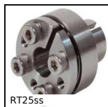
RT25ss Frette de serrage épaulée autocentrante, Couple moyen/élevé