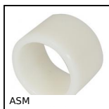
ASM Coussinet polymère cylindrique, Polymère alimentaire