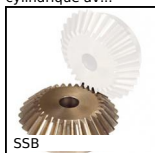
SSB Engrenage conique inox, 1:1