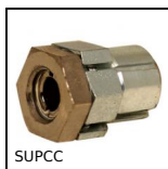
SUPCC Moyeu de serrage autocentrant acier, Avec contre-écrou