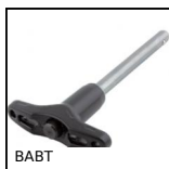
BABT Broche à billes inox trempé, Inox trempé