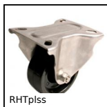
RHTplss Roulette Hautes températures, jusqu'à 200kg