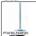
PTAF80-PAMF80 Pied articulé à embase tôle à fixer Ø80, Ø 80